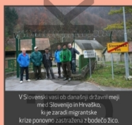
V Slovenski vasi ob danesnji državni meji med Slovenijo in Hrvaško, ki je zaradi migrantske krize ponovno zaščiteno z žično žico.