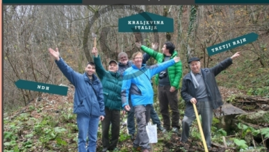
Iz te točke so slabši tri leta (1941-1943) Slovence delile tri okupacijske cone.

Lociranje tromeje je bilo označeno z začasnimi zapisom, kmalu pa namerava ZBZ NOB Krško tu postaviti primerno spominsko obeležje. Odkritje je namreč velik prispevek k rekonstrukciji poteka okupacijskih meja z najnovejšimi geografskimi metodami, kar je eden izmed temeljnih ciljev pričujoče raziskave, hkrati pa ključno pripomoč k razumevanju različnih vidikov določanja in utrjevanja meja v času druge svetovne vojne.