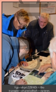
V gori pri ZBZ NDH Krško in pregled kart pred odhodom na teren.

Zaključek terenskega dela, dokončne analize raziskav, diseminacija projekta.