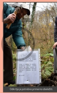
Odkritje je potrebno primerno obeležiti.