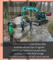
Tokaj tromeje jeva odročnem delu brežične občine, kjer na signala mobilnega telefona in je potrebno prečkati Strvine duple stropje. Na srečo se eno izmed njih ravno sanirali.