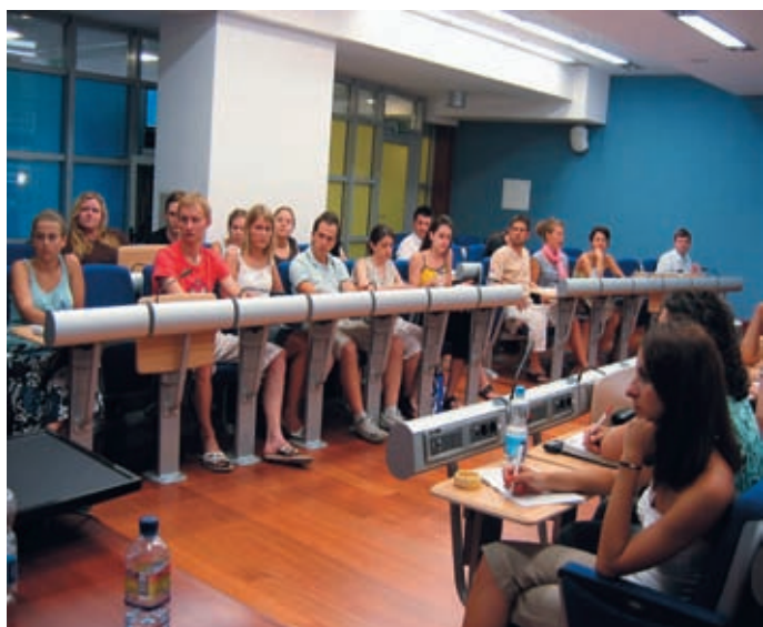
► »Vsi različni. Vsak drugačen.«

http://www.ff.uni-lj.si/fakulteta/aktualno/kronika/Upravljanje%20razlicnosti/index.htm