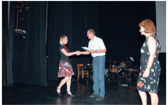
► »Otroci in mladi.«

http://www.ff.uni-lj.si/fakulteta/aktualno/kronika/tutorska%20net/index.html