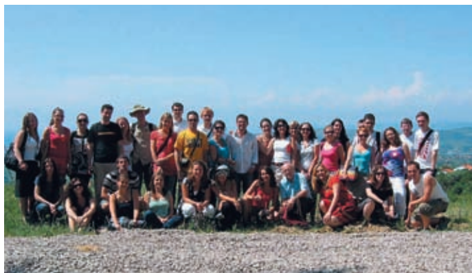
► Strokovni izlet v Trst in Koper, 2. julij 2008

http://www.ff.uni-lj.si/fakulteta/aktualno/kronika/Upravljanje%20razlicnosti/index.htm