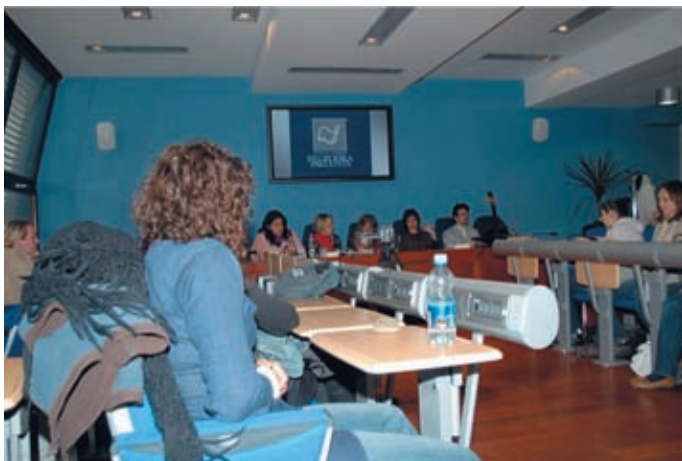
► »Besedne postaje na FF so vedno bolj obiskane.«