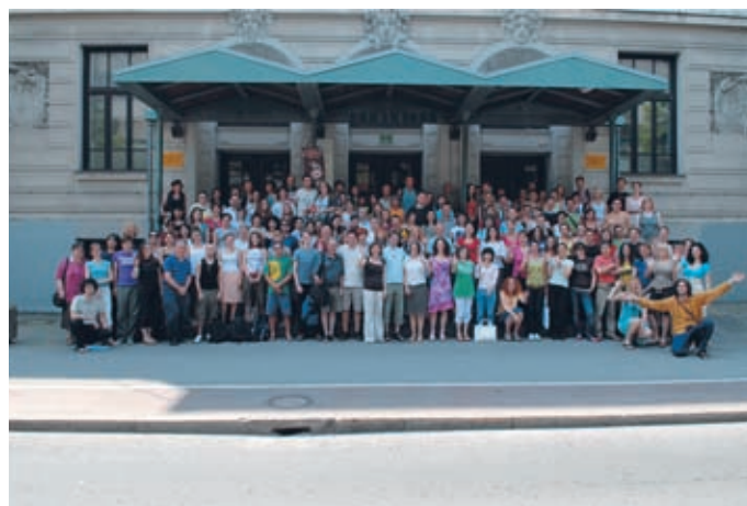
► »Ena glasofilmska pod triglavom.«