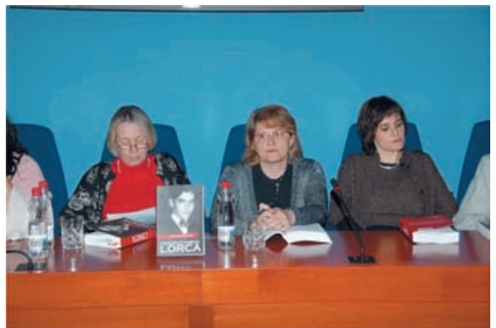
► »Utrinek z večera o Lorcí.«