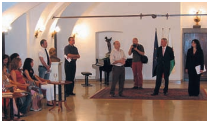
► Otvoritev poletne šole v Mestni hiši v Ljubljani